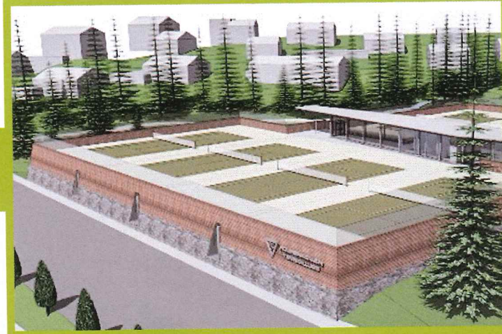
► Bautatomten, Oslo