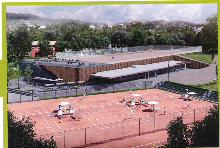
► Madserud, Oslo